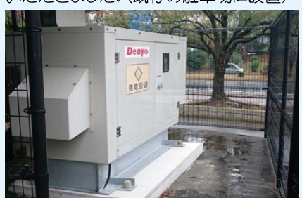
10KW出力で連続43時間稼働能力があり、管理棟(2階建ての管理事務所と集会室の3部屋等)の電源を確保。