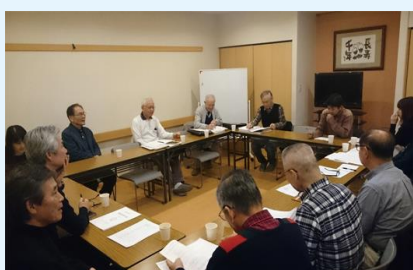
朝日プラザ管理組合理事長及び自治会長も同席され自主防災委員会の方々と藤和の防災委員との意見交換をいたしました。