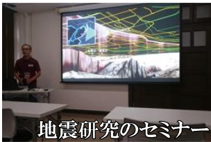
地震研究のセミナー