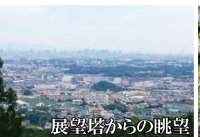
展望塔からの眺望