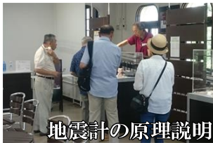
地震計の原理説明